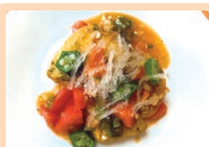
夏バテ防止!! ささみのトマト、オクラソース 牧野 琴穂 (中津川市 坂本小学校)