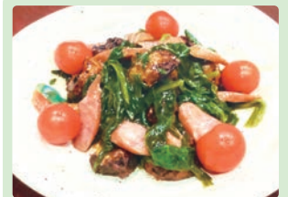
寒干し大根のからあげあんかけ 座主 奏 (飛騨市 山之村小学校)