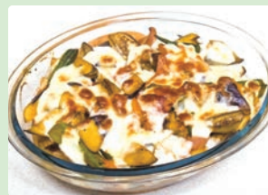
ナス・トマト・オクラのラタトゥーユ風チーズ焼き 西山 泰智 (中津川市 山口小学校)