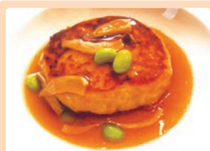
ヘルシー和風ハンバーグ 各務 結栞 (可児市 土田小学校)