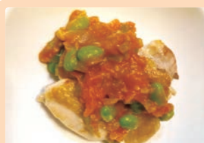
恵那鶏と夏野菜のゴロゴロソース 志村 心菜 (中津川市 西小学校)