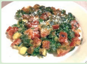
夏野菜たっぷりガレット 中島 唯千香 (岐阜市 則武小学校)