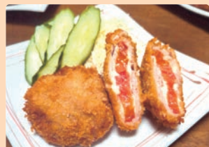
トマトかつ 竹内 朗真 (多治見市 滝呂小学校)