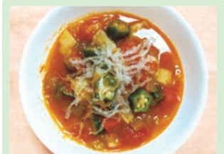
食べごたえ満点!野菜たっぷりミネストローネ 牧野 貴穂 (中津川市 坂本小学校)