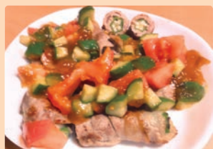
オクラの肉まき 夏野菜あんかけ 竹原 みちる (岐阜市 則武小学校)