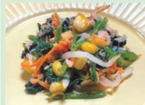
カルシウムたっぷりのさっぱり和え 水野 志音 (土岐市 肥田小学校)