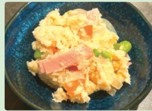
おまめたっぷりポテトサラダ 丸山 恵奈 (垂井町 表佐小学校)