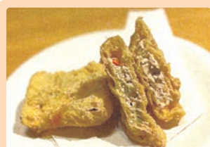
彩り野菜とお肉のサクサクあげ 千村 彩稀 (中津川市 坂本小学校)