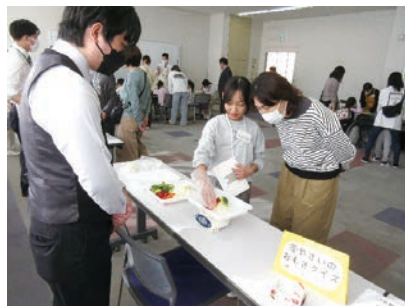
野菜のおもさクイズ