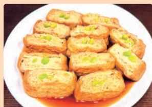
油あげのつつみに 細江 真叶 (岐阜市 鵜小学校)