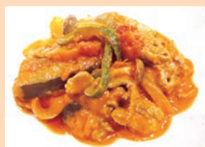
夏野菜たっぷりビーフストロガノフ 近藤 結莉 (養老町 笠郷小学校)