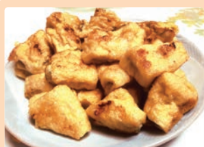
あげづめとうふナゲット 大鋸 絢根 (八百津町 八百津小学校)